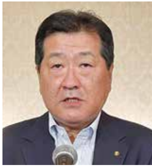
長橋副実行委員長挨拶