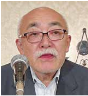
板垣実行委員長挨拶