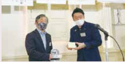
新旧会長バッチ交換