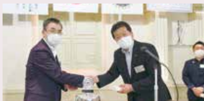
新旧幹事バッチ交換