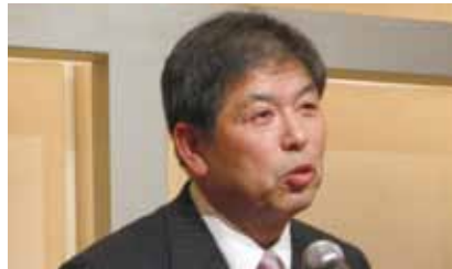
三浦会長エレクト 乾杯