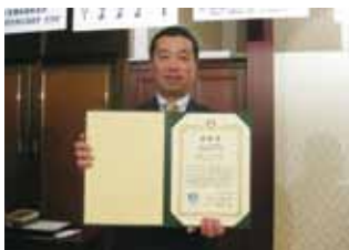
地区大会…会員増強表彰