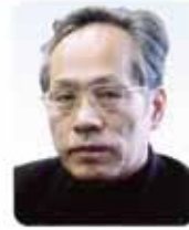
評論家 佐高 信氏 Makoto Satake