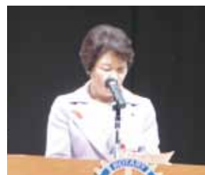
吉村美栄子県知事