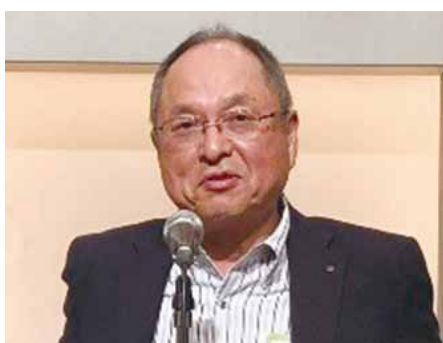
懇親会担当RC…中川会長挨拶