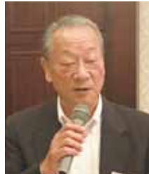
第19代 安藤パスト会長