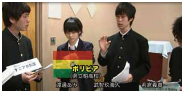
ボリビア (県立柏高校)