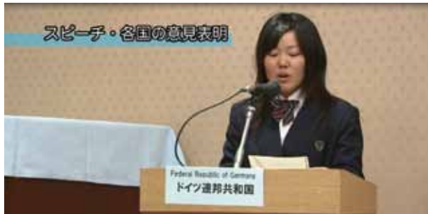
スピーチ・各国の意見表明