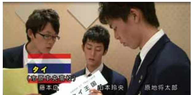
タイ (市原中央高校)