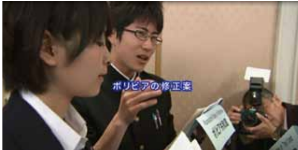
ボリビアの修正案