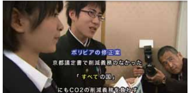
ボリビアの修正案 京都議定書で削減義務のなかった 「すべての国」 にもCO2の削減義務を負わせ