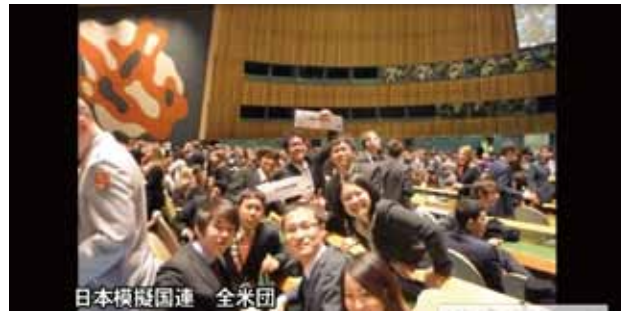
日本模擬国連 全米団