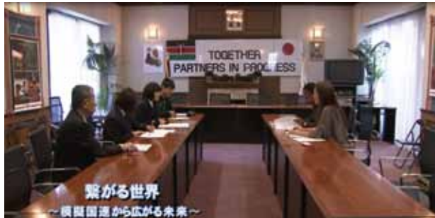
繋がる世界 ~模擬国連から広がる未来~