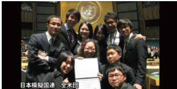
日本模擬国連 全米団

地球温暖化防止・国際気候変動対策 青少年による環境をテーマとする模擬国連 主催 国際ロータリー第2790地区