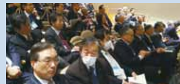
3.17 地区合同セミナー