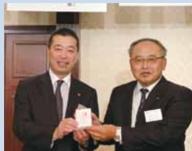
鹿野会員が20年出席優良表彰