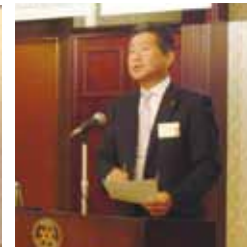
次年度副会長を指名