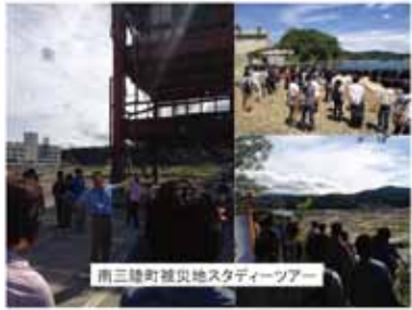
南三陸町被災地スタディツアー