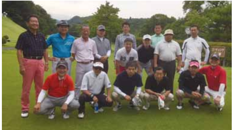
最終例会ゴルフコンペ(蔵王CC)