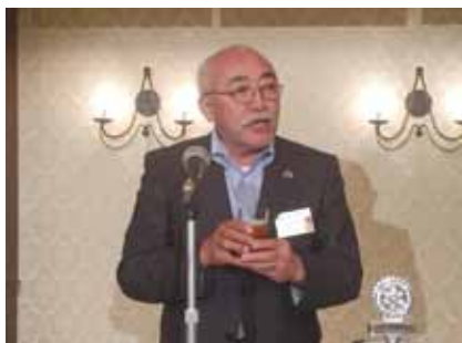
新ガバナー補佐乾杯