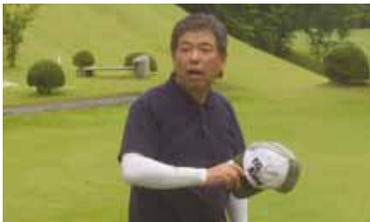
ゴルフ場での開会の挨拶