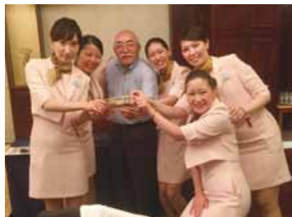
レセプタントに大入袋